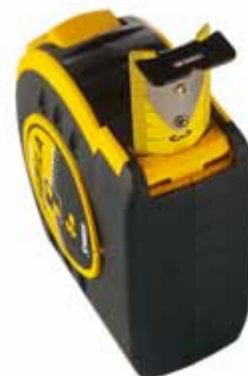
Amortissement du retour du ruban