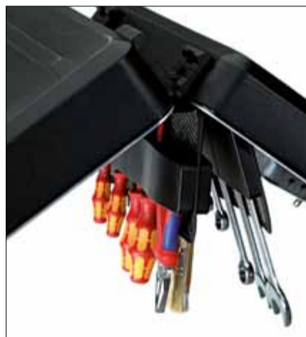
Porte-outils breveté CP-7 avec effet de serrage

Ce système, bien plus simple et plus souple lorsqu'il s'agit de ranger les outils, est notamment caractérisé par un effet de serrage maintenant les outils en place.