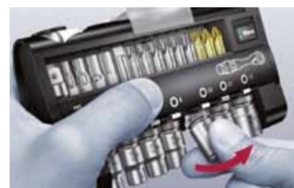
Tool-Check – avec douilles

Utilisation facilitée, même d'une seule main. Réalisation 100% acier forgé dans la masse, avec transmission de couple incroyablement élevée. Cliquet à tête ergonomique, avec géométrie Kraftform offrant aux doigts une ergonomie idéale.