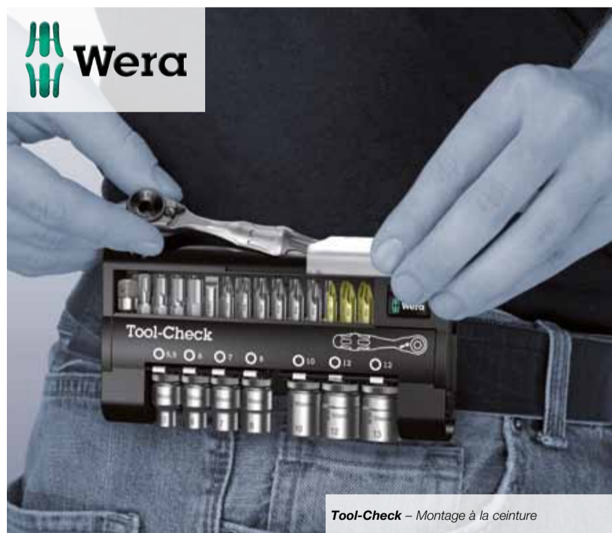
Tool-Check – Montage à la ceinture

manchon de serrage rapide pour un échange éclair des embouts ■ Mini-cliquet à embouts 1/4" pour un travail rapide dans les situations où la place est réduite. Rotation rapide – à l'aide du pouce – grâce à la molette équipant la tête du cliquet.