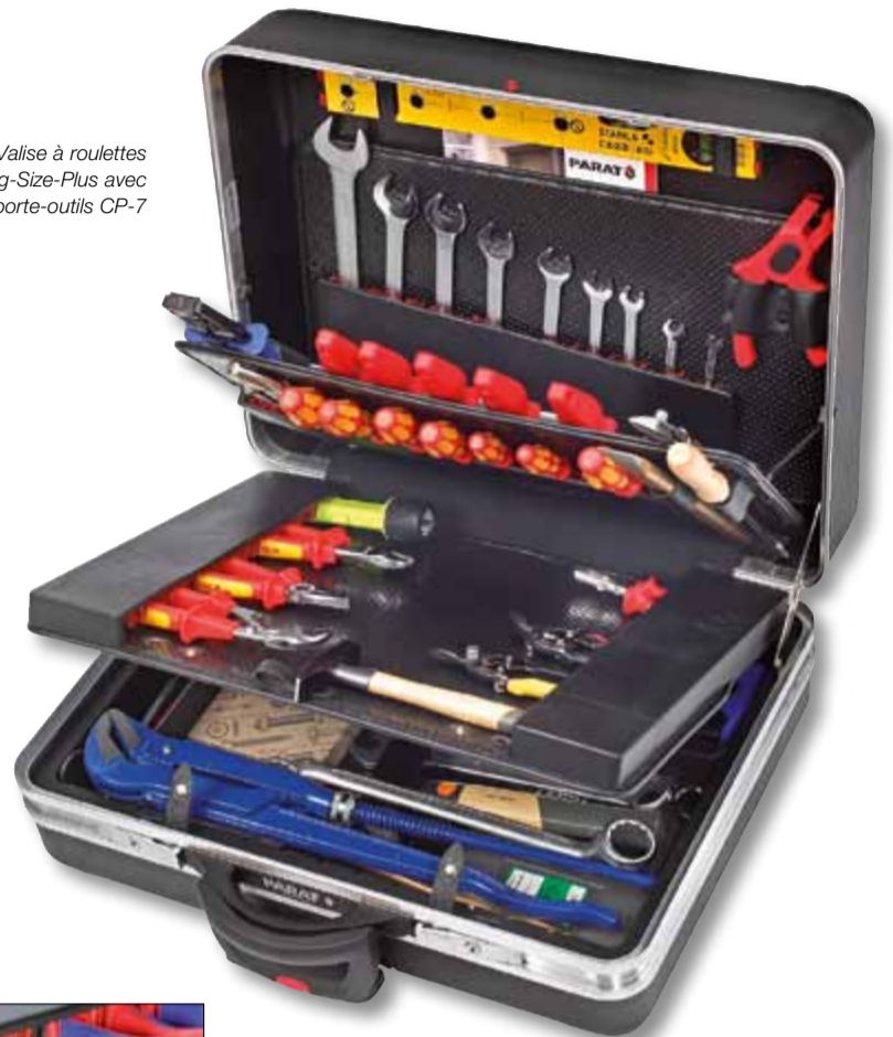
Valise à roulettes King-Size-Plus avec porte-outils CP-7