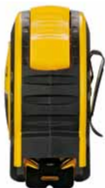
Crochet spikes et anneau de fixation