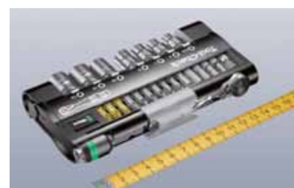
Tool-Check – 38 pièces sur 15 x 8 cm