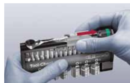
Tool-Check – avec Mini-Cliquet à embouts