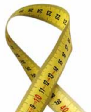
Graduation imprimée des deux côtés