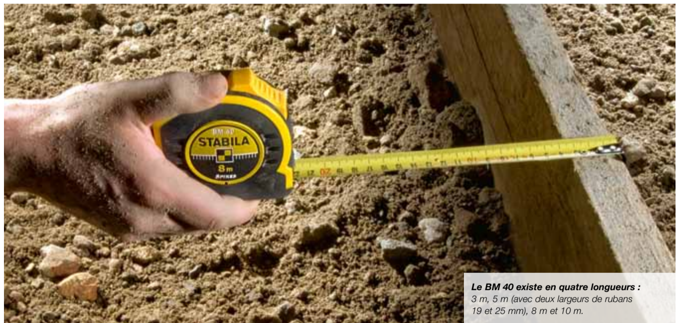
Le BM 40 existe en quatre longueurs : 3 m, 5 m (avec deux largeurs de rubans 19 et 25 mm), 8 m et 10 m.