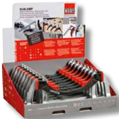
Présentoir de comptoir

La presse à serrage rapide légère KLI Kliklamp existe également en présentoir de comptoir de 16 pièces ainsi qu'en Systainer.