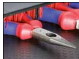
Fond compartimentable avec compartiment pour outils longs