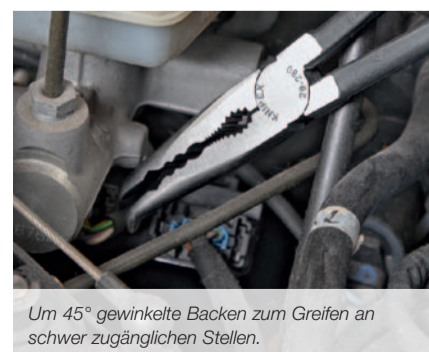
Um 45° gewinkelte Backen zum Greifen an schwer zugänglichen Stellen.