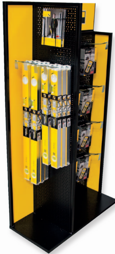
Fragen Sie den für Sie zuständigen Außendienstmitarbeiter nach diesen Displays oder rufen Sie uns direkt an: +49 6346 309-0

Das ebenfalls neue Startup-Display ist eine praktische Präsentationsmöglichkeit für Händler, die noch keine STABILA Produkte führen und denen keine freien Wandflächen zur Verfügung stehen.