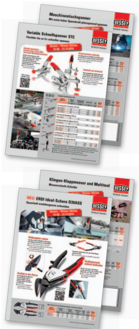
Unser Prospektmaterial zur Aktion in gedruckter oder digitaler Form

Wir freuen uns auf eine erfolgreiche Aktion gemeinsam mit Ihnen!