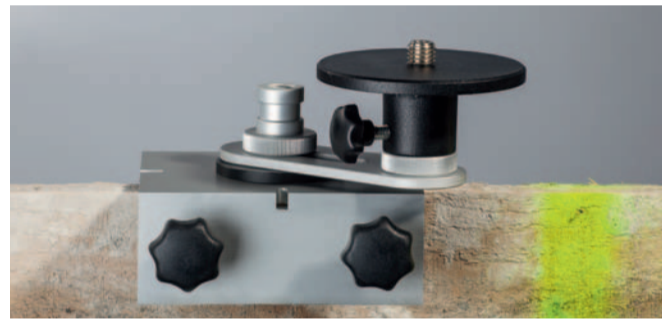
Schnurgerüsthälter SR 100