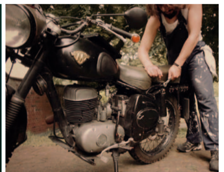
Männertraum – Neues Tool Rebel Video zu sehen unter www.toolrebels.de