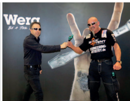
Mr. Hayabusa: Der wahrscheinlich schnellste Tool Rebel der Welt