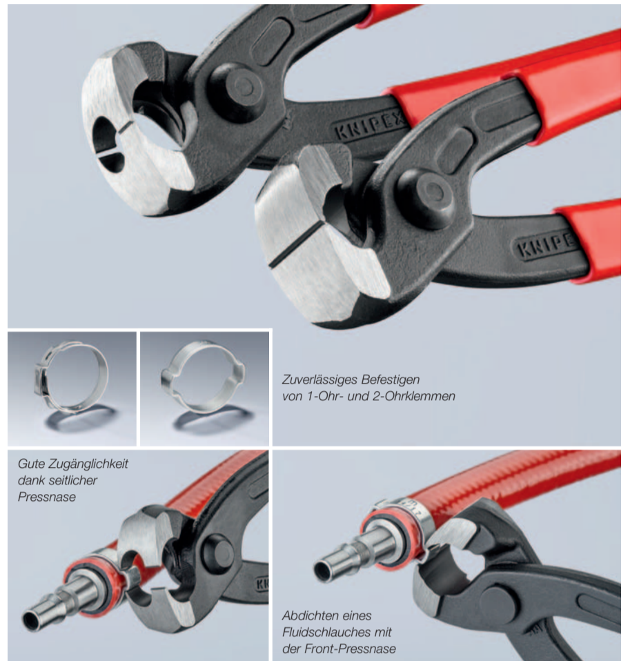
Zuverlässiges Befestigen von 1-Ohr- und 2-Ohrklemmen